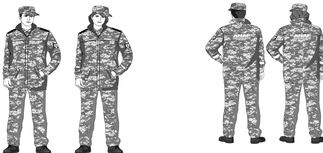
Figura 2 — Modelul uniformei de serviciu de iarnă — bărbați și femei

— scurtă toamnă/iarnă — bărbați și femei, confecționată din țesătură trei straturi, imperrespirabilă, care asigură protecția împotriva intemperțiilor, în culorile camuflajului digital urban, din trei nuanțe de gri, de la alb la negru. Este compusă din piepți, spate, mâneci, guler, platcă, epoleți, manșete și este prevăzută cu fermoar dublu-sens, mesadă și glugă detașabilă. Pe mâneca stângă este aplicată emblema pentru echipament descrisă în prezenta anexă, pe partea din față în zona superioară stângă textul: „A.N.A.F.”, în zona superioară dreaptă textul „EXECUTĂRI SILITE”, iar pe partea din spate în zona superioară de mijloc este aplicat textul: „A.N.A.F. — EXECUTĂRI SILITE”, de culoare alb fosforescent. Pe ambele mâneci, în zona inferioară, sunt aplicate benzi de culoare gri fosforescent.