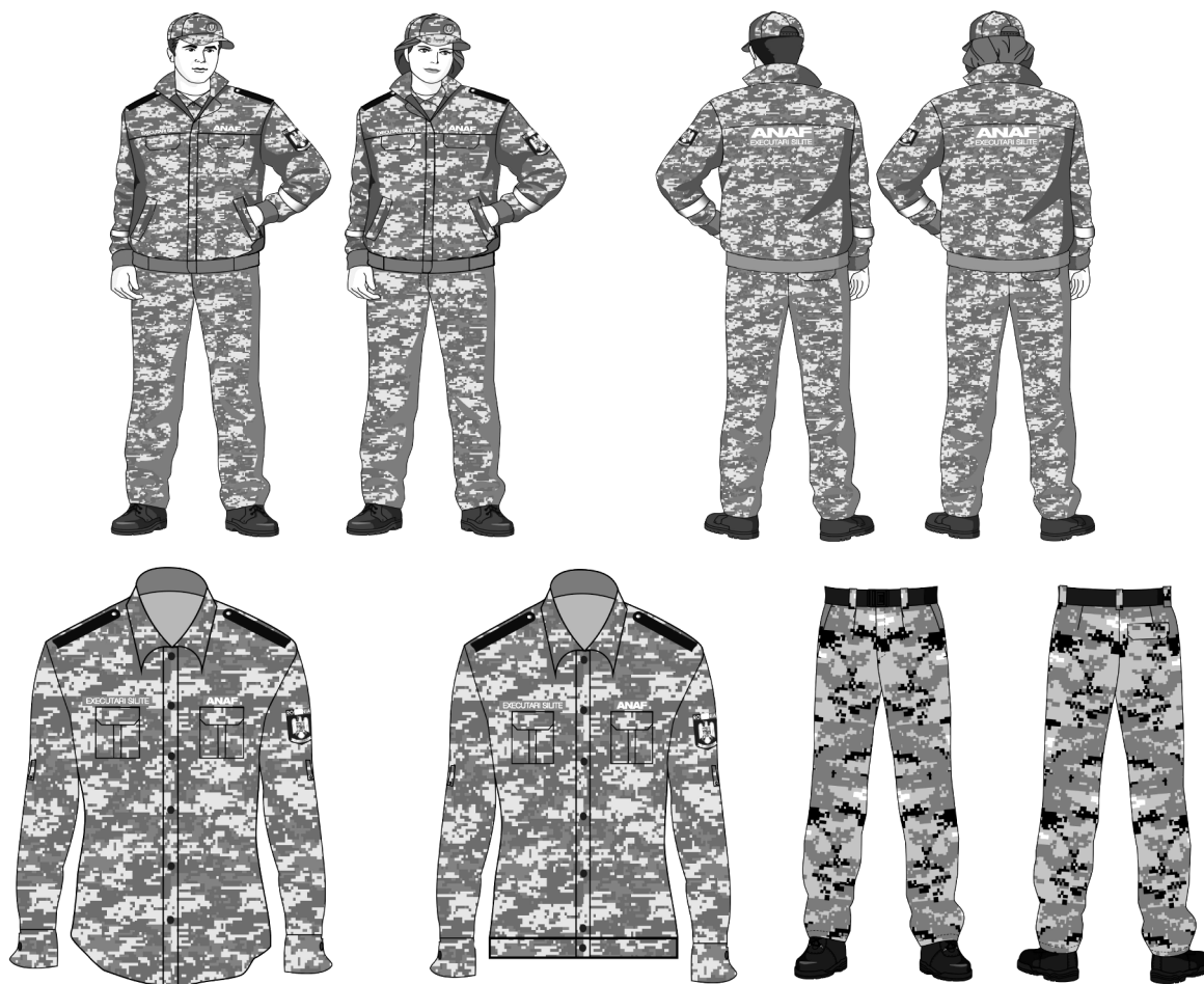
Figura 1 — Modelul uniformei de serviciu de vară — bărbați și femei

— bocanci vară, prevăzuți cu șiret, confecționați din piele și material textil de culoare neagră, impermeabile. Sunt căptușiți cu inserție imperrespirantă, iar talpa este din poliuretan și cauciuc care asigură protecție împotriva agresiunilor mecanice (abraziune, agățare), alunecare și protecția călcâiului împotriva șocurilor mecanice și a compresiunii.