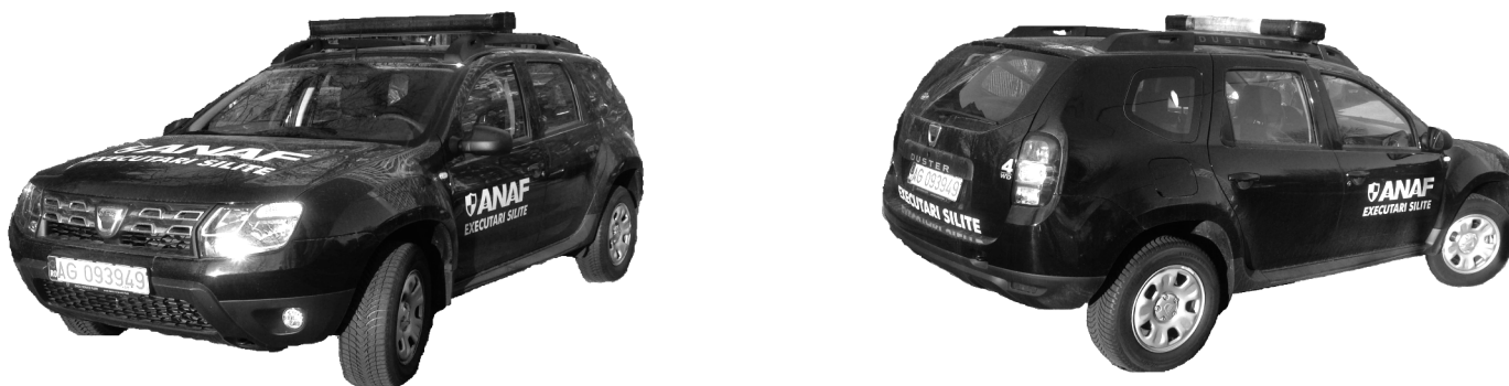
Figura 4 — Modele privind inscripționarea autovehiculelor cu destinație specială și modul de prindere a instalației de semnalizare luminoasă

Mijlocul de semnalizare luminoasă montat pe autoturismele aflate în dotare se poate folosi atunci când: