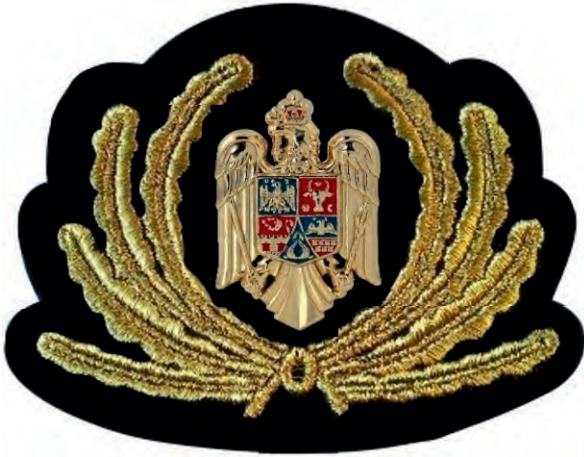
Petlițe pentru director general/director general adjunct