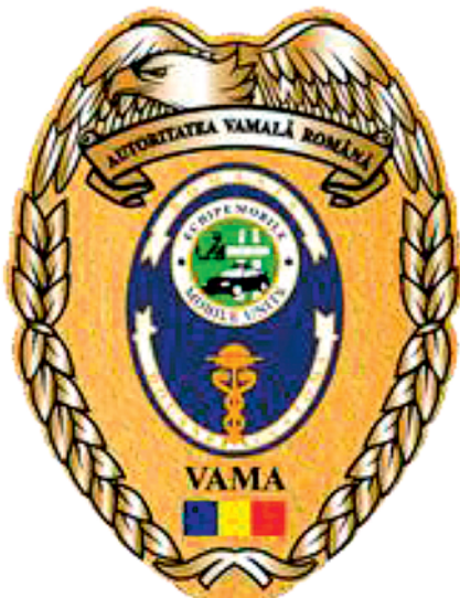
Emblemă echipe mobile pentru mânăcă