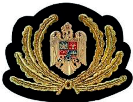
Emblemă coifură pentru director general/ director general adjunct