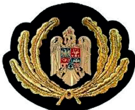
Emblemă coifură/șapcă pentru funcții de conducere