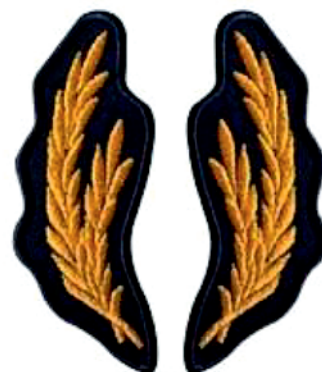
Petlițe pentru funcții de execuție