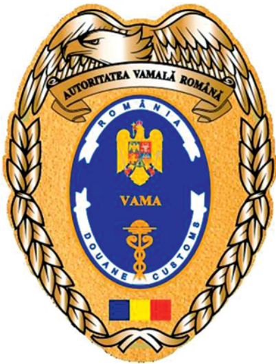
Emblemă vamă pentru mânăcă