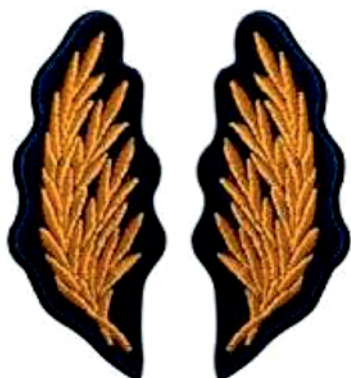
Petlițe pentru director general/ director general adjunct