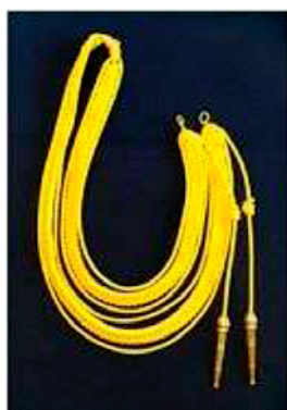
Eghileți pentru funcții de conducere