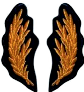
Petlițe pentru funcții de conducere